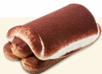
Mini Tiramisú ref. 67310