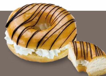
SmileDots® White ref. 67150

Máxima practicidad y protección. Llega completamente acabado, sólo necesitan descongelar y exponer. ¡Destácalos en tu nevera de pastelería y dale un plus a tu exposición!