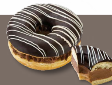
SmileDots® Black ref. 67120